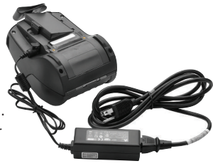
Zur Information mit Drucker abgebildet; Drucker nicht inbegriffen

Schließen Sie den Wechselstromadapter an den QLn-Drucker und die Netzsteckdose an, um den intelligenten Akku des Druckers im Drucker aufzuladen. Der Drucker kann während der Aufladung Etiketten drucken und andere Vorgänge durchführen.