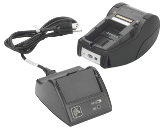
Zur Information mit Drucker abgebildet; Drucker nicht inbegriffen

Das intelligente Akku-Ladegerät lädt einen einzelnen intelligenten QLn-Akku außerhalb des Druckers in weniger als vier Stunden auf. Neben dem Ladestatus wird auch der Funktionsstatus des Akkus angezeigt, was eine genauere Verwaltung Ihres Reserveakku-Bestands ermöglicht. Die LEDs zeigen insbesondere an, ob der Akku „gut“ ist, ob seine „Kapazität eingeschränkt“ ist, er die „Nutzungsdauer überschritten“ hat oder „unbrauchbar“ ist und ausgewechselt werden sollte. Das intelligente Ladegerät wird mit Ladestation und Netzkabel geliefert.